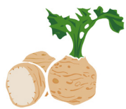
Celer kori- jen